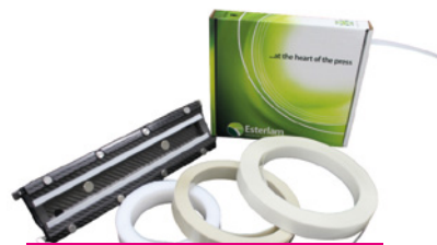
Esterlam Doctor Blades